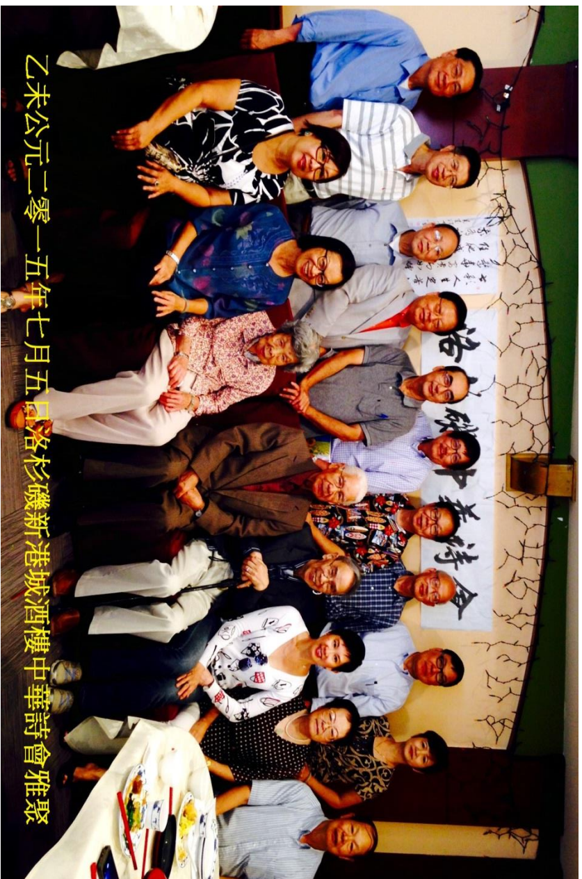
乙未公元二零一五年七月五日洛杉磯新港城酒樓中華詩會雅聚