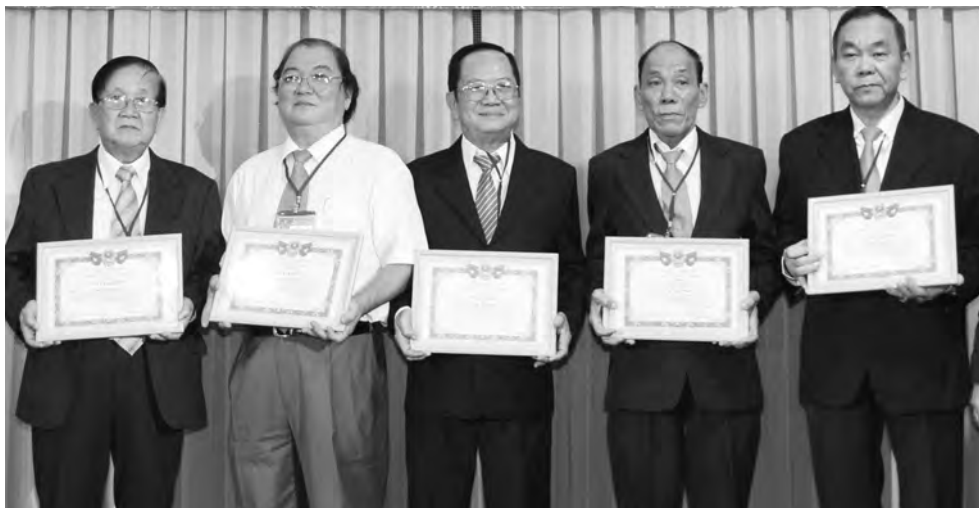
歐姬華文中心董事會諸位董事榮獲第十一郡教科表彰。

據悉，歐姬小學正在重建中，估計在本年底建竣，屆時將遷回舊址的新校舍繼續上課。