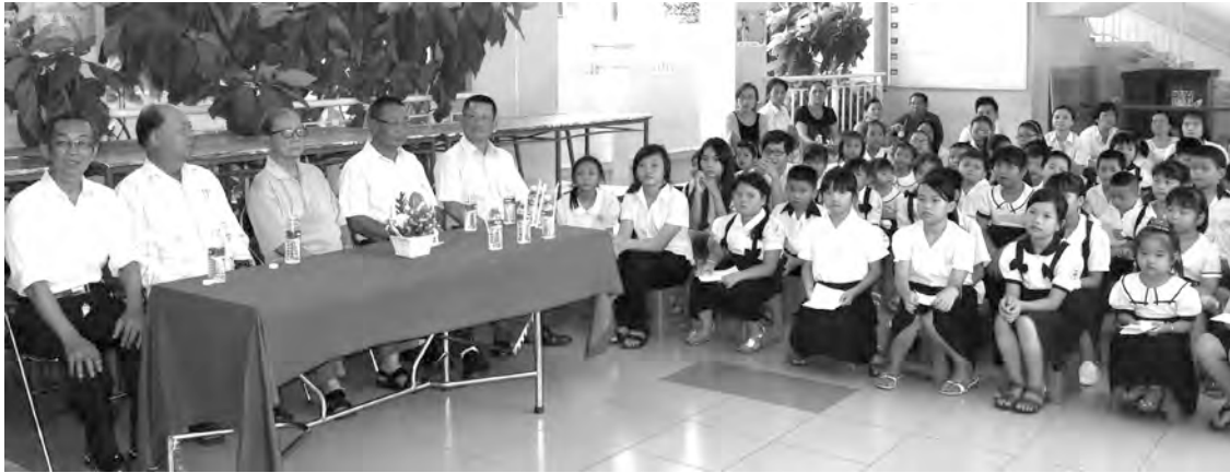
歐姬華文中心諸位董事和學生們出席2014—2015學年度結業典禮。該中心獎勵6位教師及23取得前3名的優秀生，另嘉獎於投稿寫作學生。