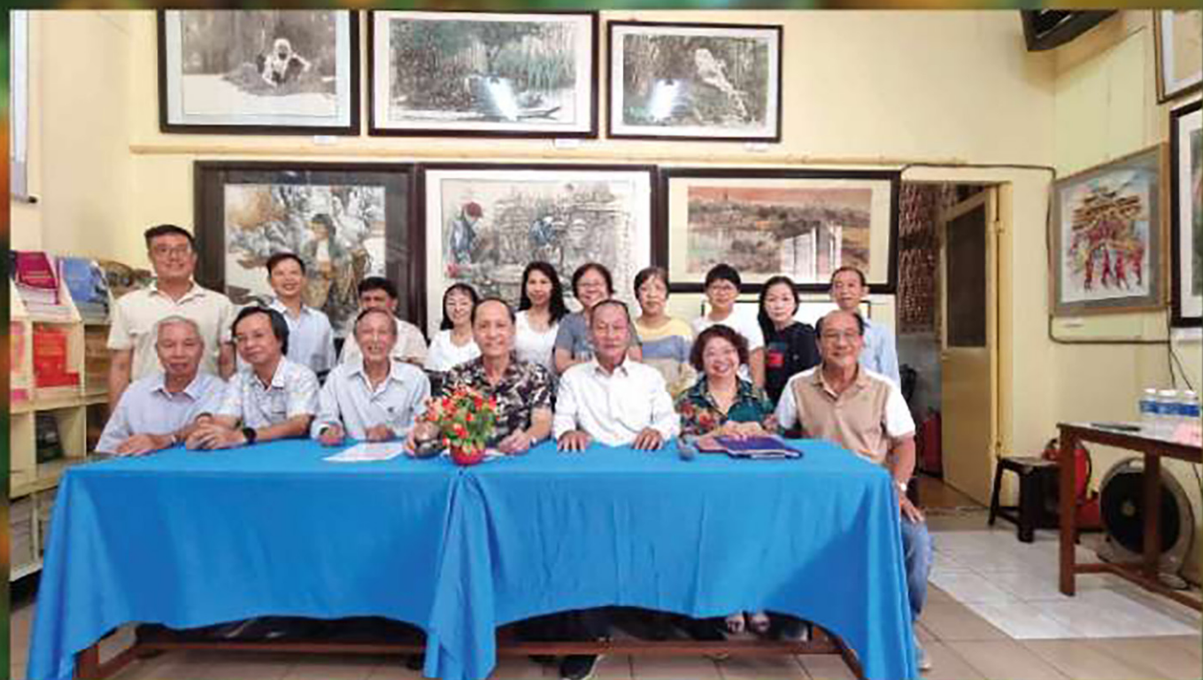
胡志明市華人文學五十年活動專題座談會